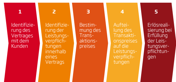
Abb. 1: Die fünf Schritte des IFRS 15 zur Erlösrealisierung